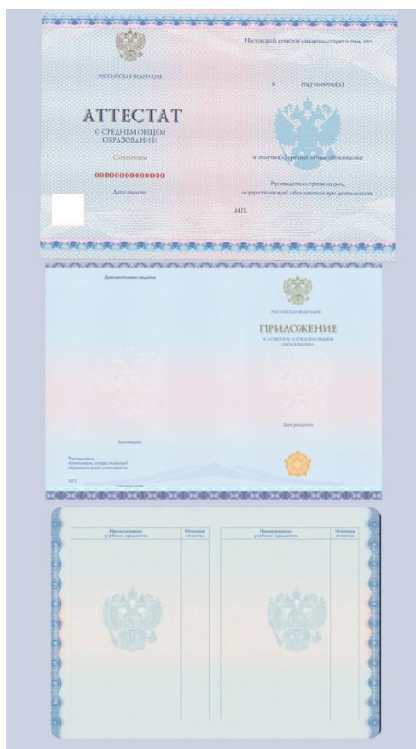
Рис. 3. Пример прикрепления всех нужных страниц аттестата

Документ об образовании включает в себя все страницы аттестата/диплома, в том числе приложения (рис. 3). Все страницы документа должны быть подкреплены в один файл, размер которого не должен превышать 30 МБ.