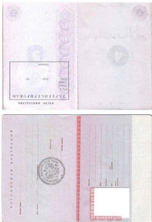
Рис. 4. Пример прикрепления всех нужных страниц паспорта

Сервисы для сжатия и объединения файлов: